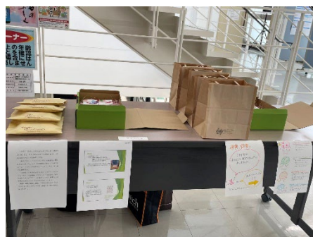
シンポジウムへの出店(9月)