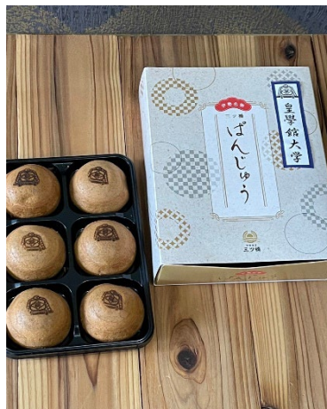
萼の会にて販売した ばんじゅう(5月)