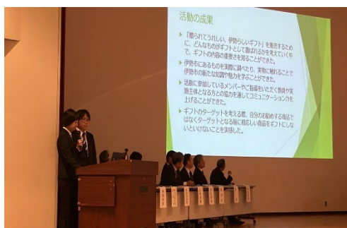
萼の会での発表(5月)

ただ売れば良いというのではなく、シンポジウムに来た人がどんなきっかけでギフトを買うのかということイメージし、その商品の魅力が伝わる工夫をする必要があることを学びました。