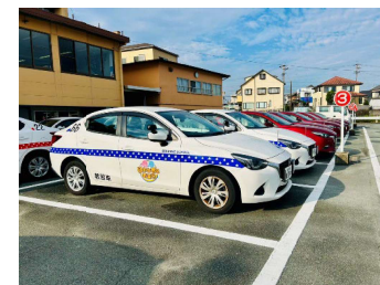
撮影に使用する教習車