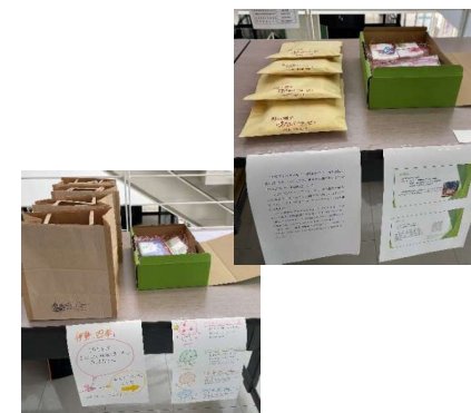
シンポジウムへの出店